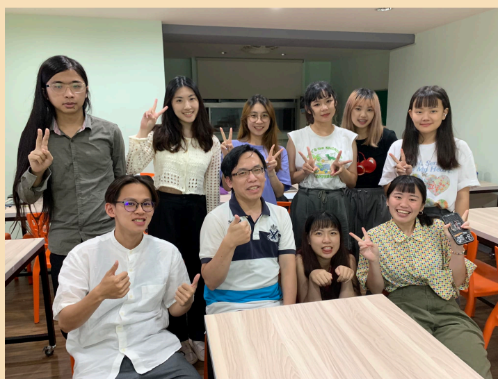
▲ 專案企劃實務工作坊

透過問題導向式學習(PBL)，運用系統化引導學生思考與創作，由系所教師與業界專家群，協助學生透過設計思考方式從「同理心」、「需求定義」、「創意動腦」、「製作原型」、「實際測試」等各階段進行討論；由教師擔任觀察員紀錄學生如何運用基礎課程與核心課程所學，用於回饋課程調整修正。